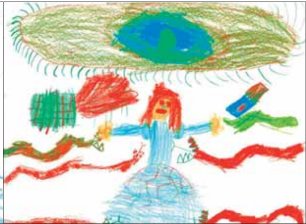
Lola - L2