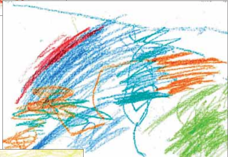
Han - K2