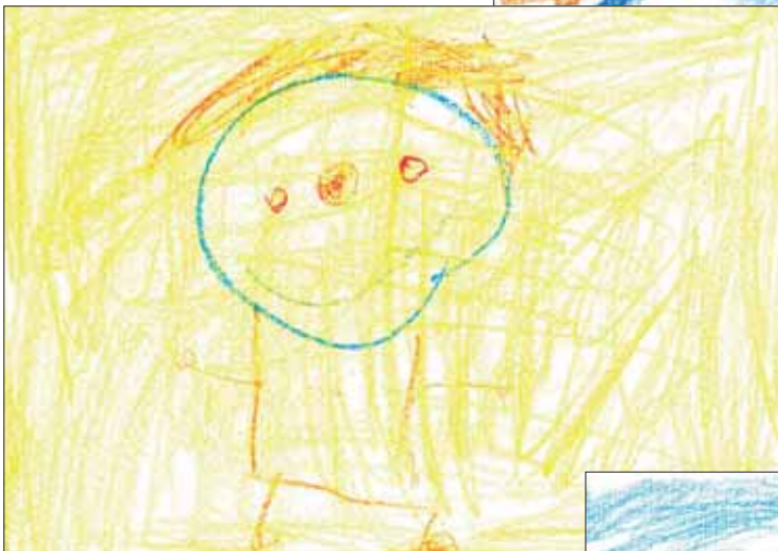
Zorn - K3