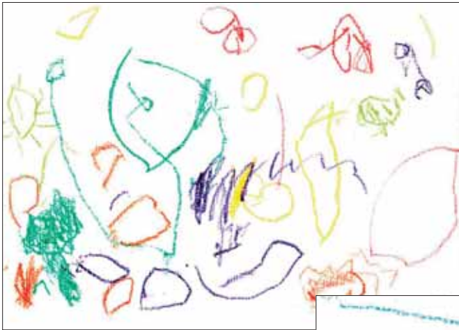
Elle - K1