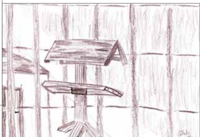
Niki - L5