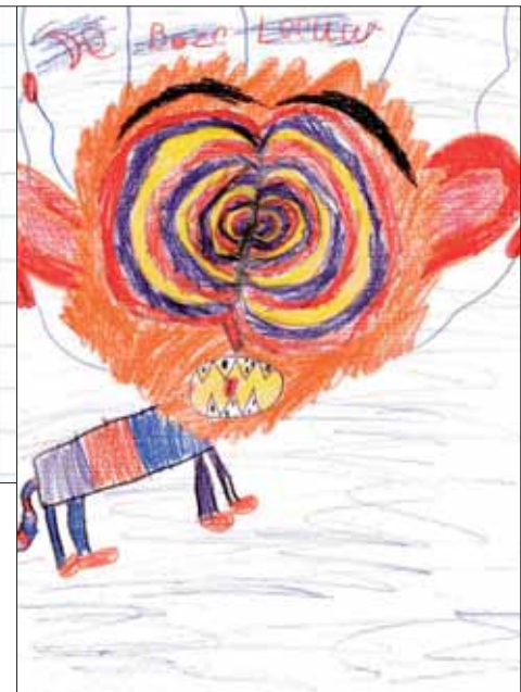
Iridan - L4