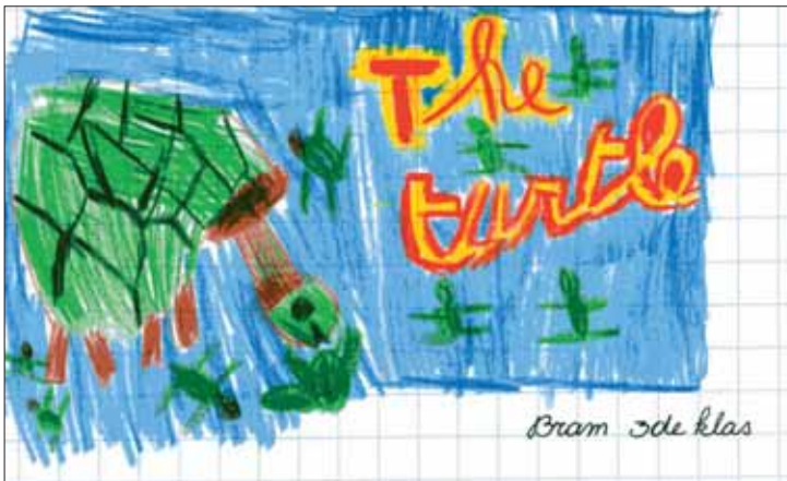
Bram - L3