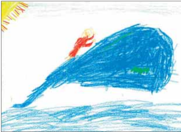
Isis - L1