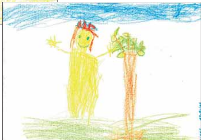
Lieke - K4